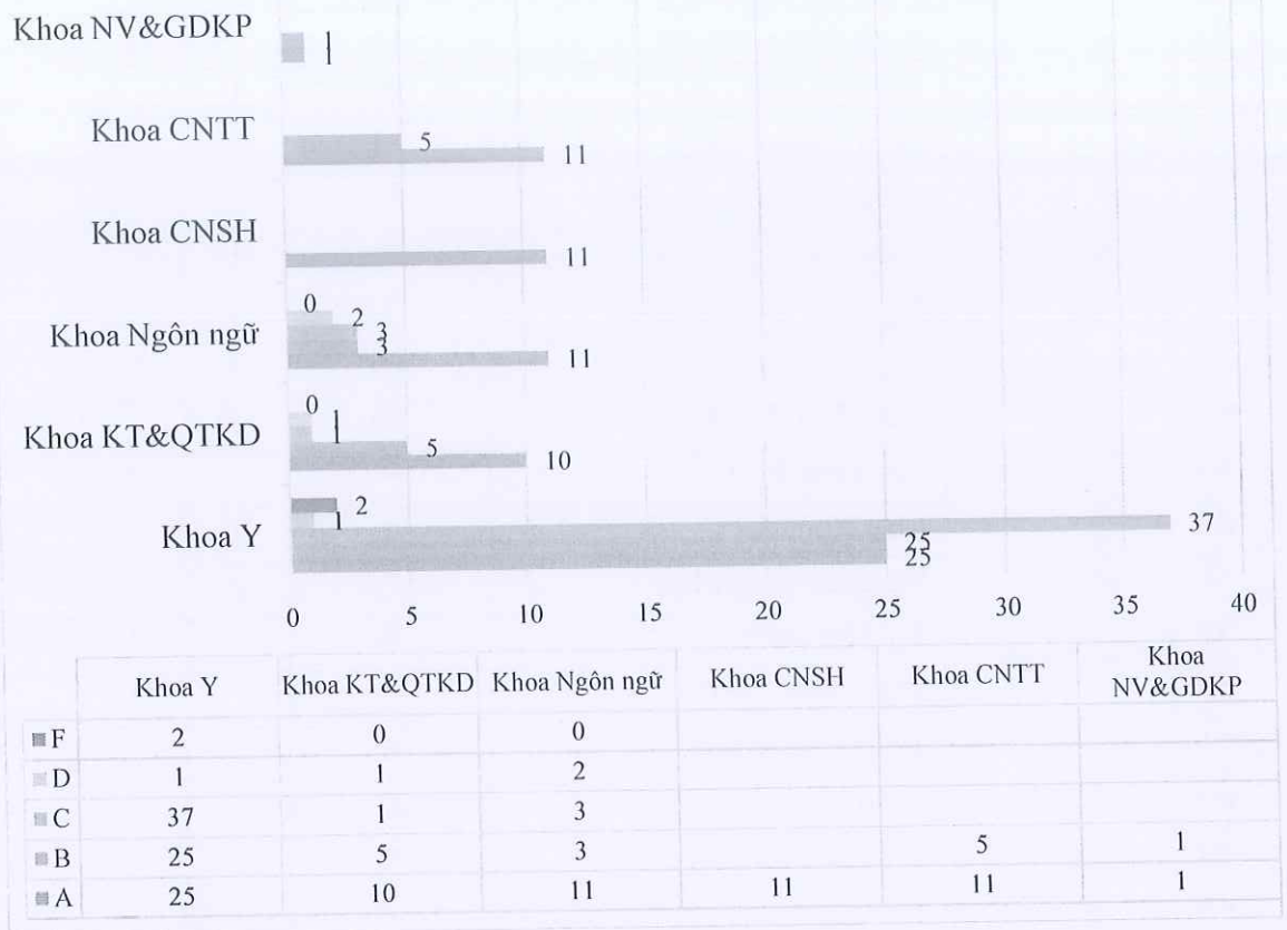
Biểu đồ 2. Thống kê xếp loại học phần theo khoa